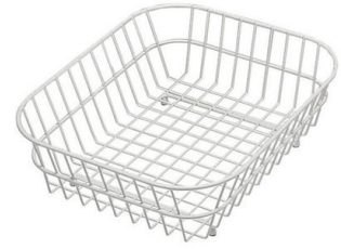
Panier en acier inoxydable

* uniquement en combinaison avec l'accessoire 8644 101