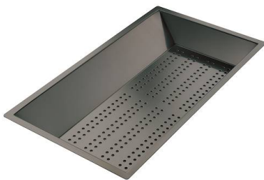
Cuvette perforée en acier inoxydable PVD Gun Metal