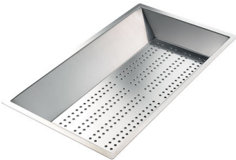
Cuvette perforée en acier inoxydable