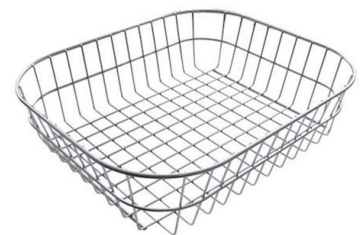
Panier en acier inoxydable

* uniquement en combinaison avec l'accessoire 8644 101