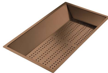
Cuvette perforée en acier inoxydable PVD Copper

* uniquement en combinaison avec l'accessoire 8644 101