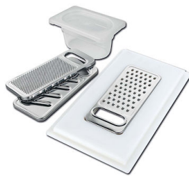
Kit râpes avec anneau de support et cuvette