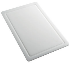
Planche de découpe en HPDE