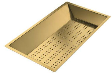
Cuvette perforée en acier inoxydable PVD Gold